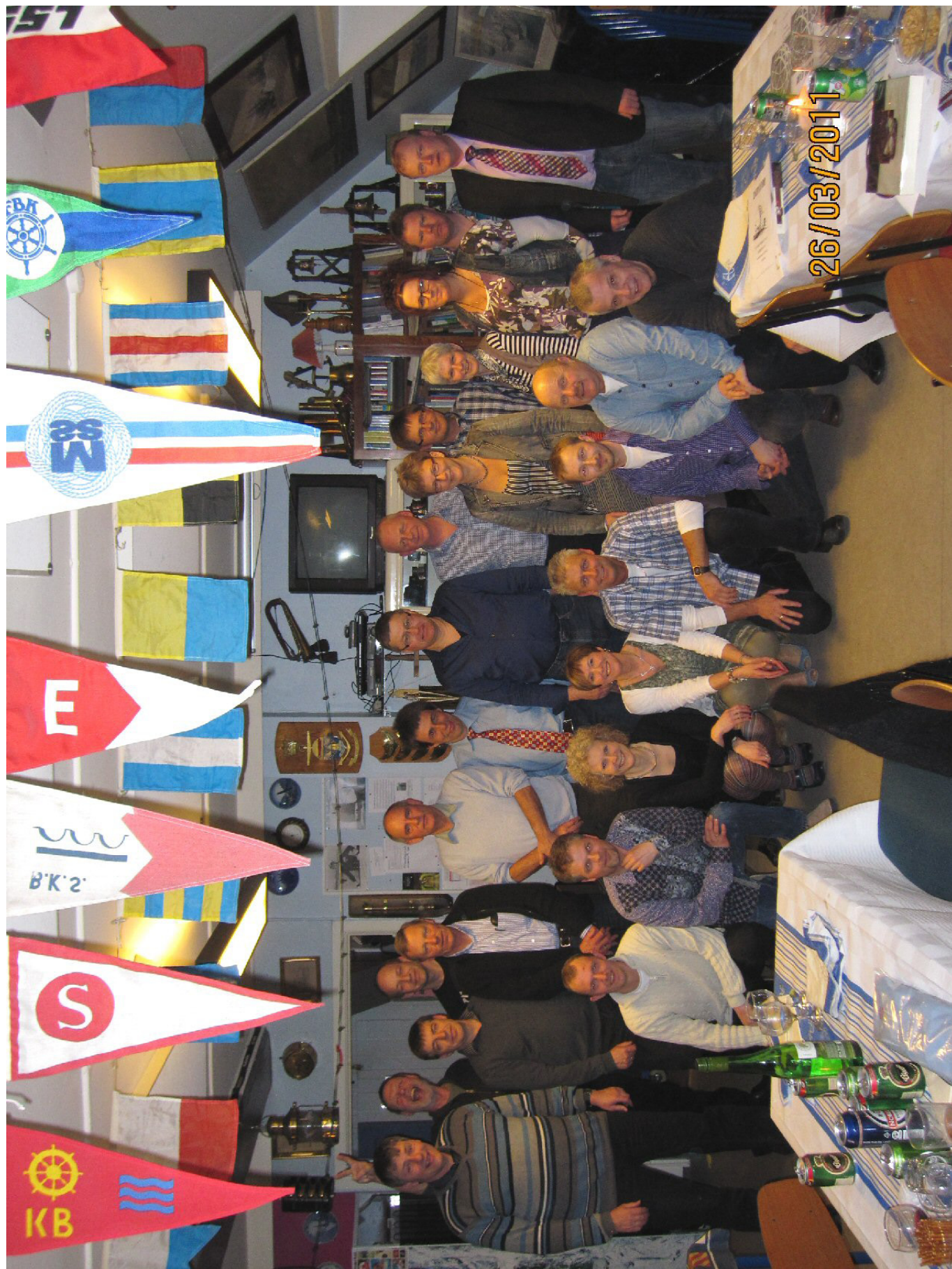
Venskabsaftenen i SIF København badminton, blev med stor succes afholdt i Marinestuen